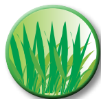
Les déchets de tonte